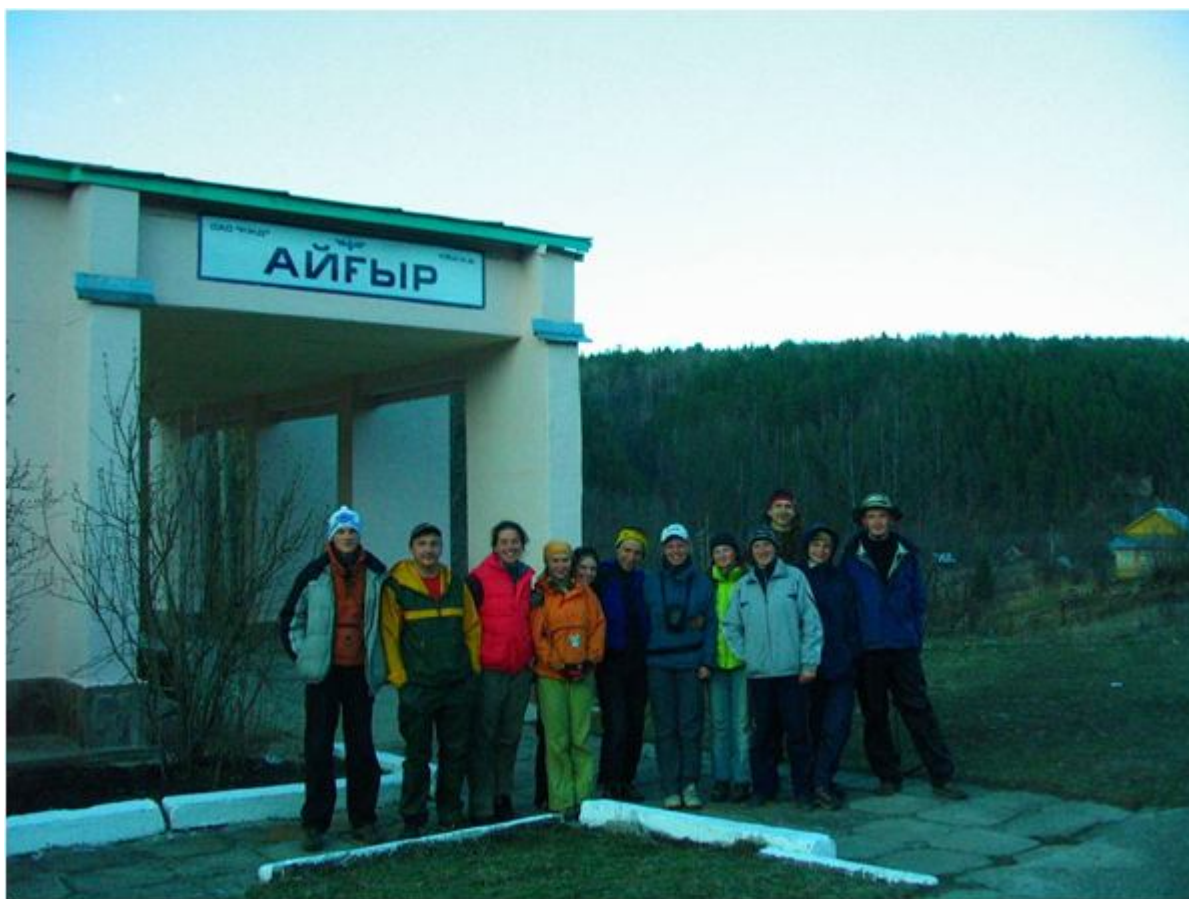
Фото №11. На станции Айгир.