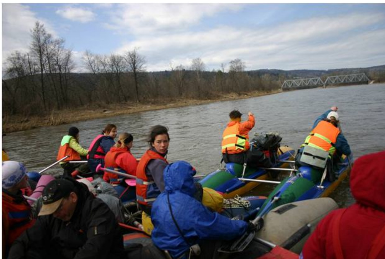
Фото №18. Ж/д мост перед пос.Манышта.