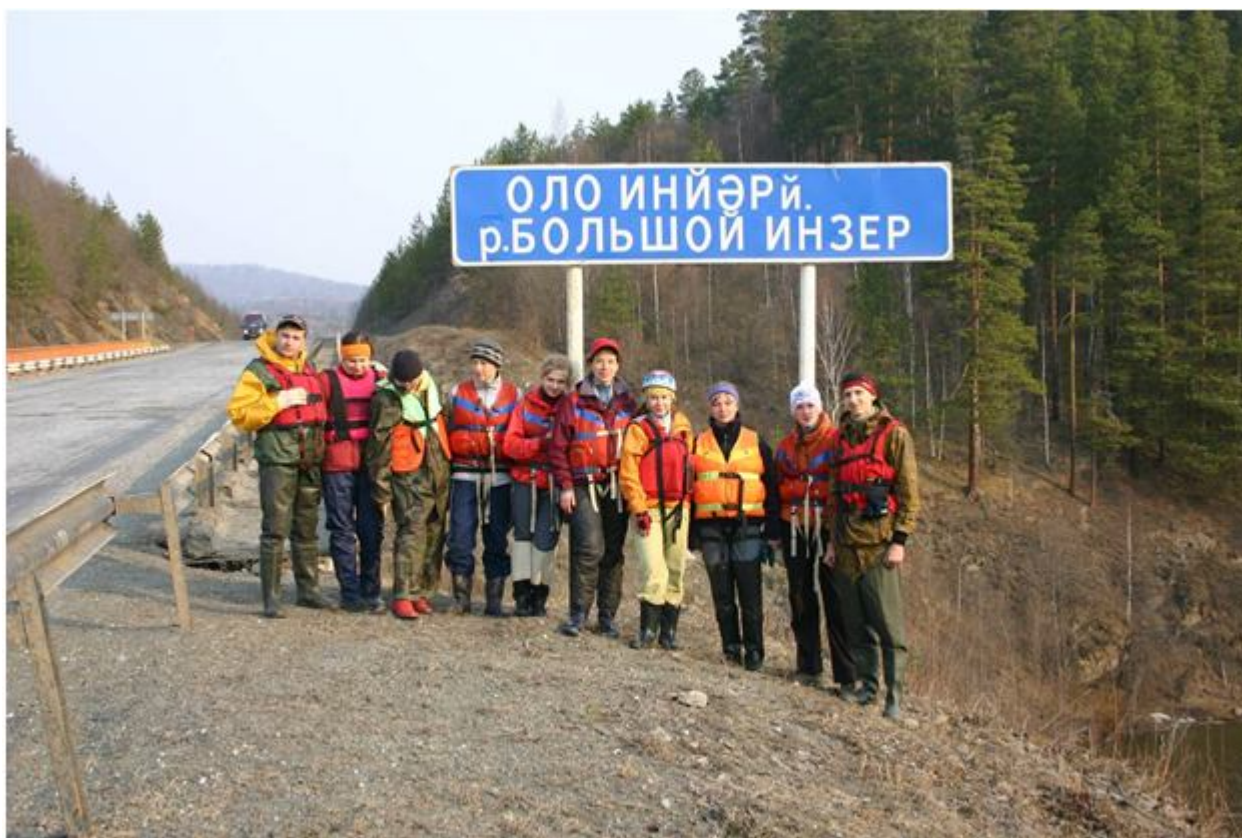
Фото №. 1. На старте.