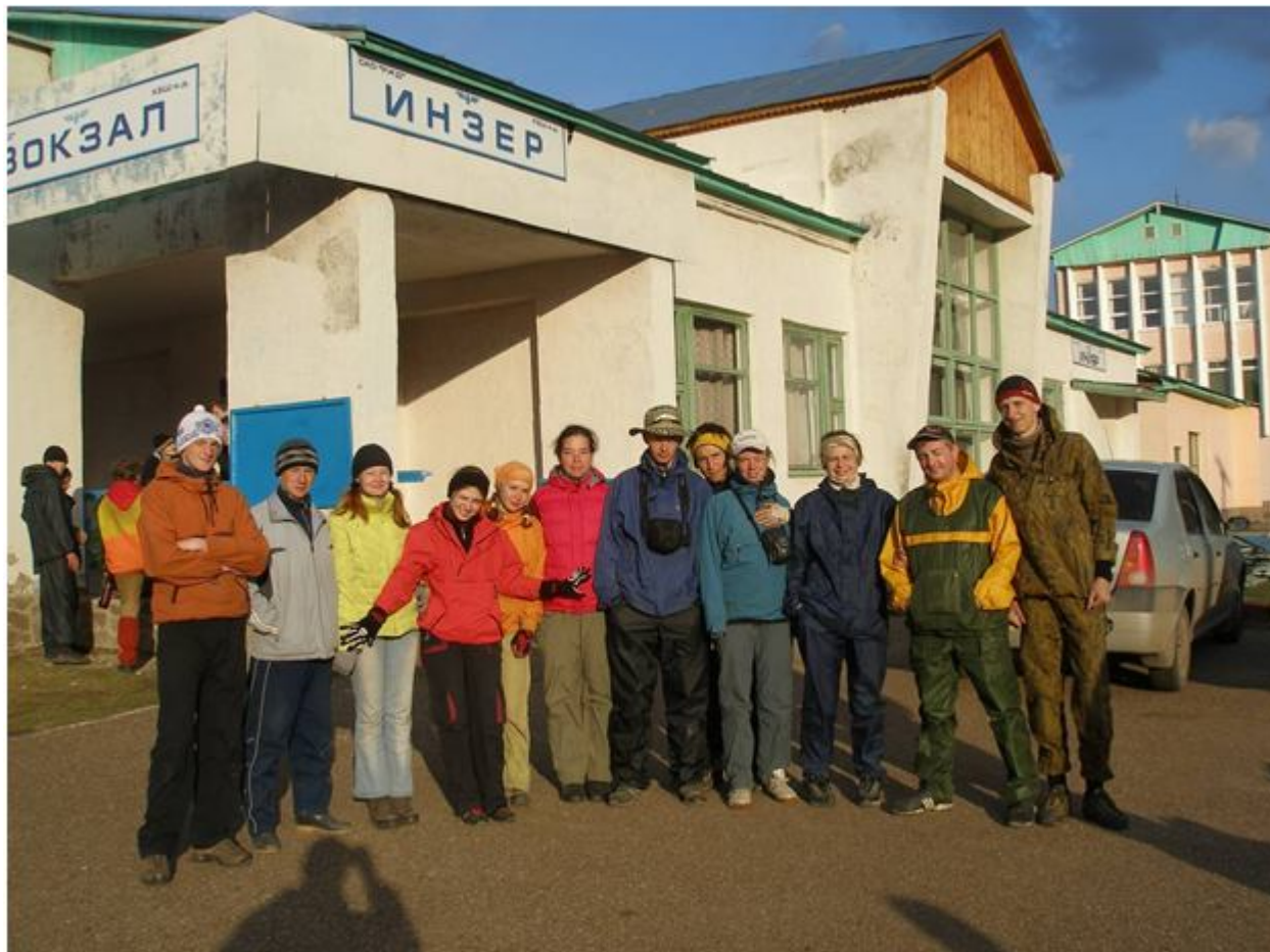
Фото №10. На станции Инзер – переезд на реку Малый Инзер.