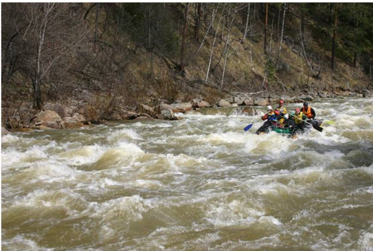
Фото №14. Прохождение порога Синие Скалы.