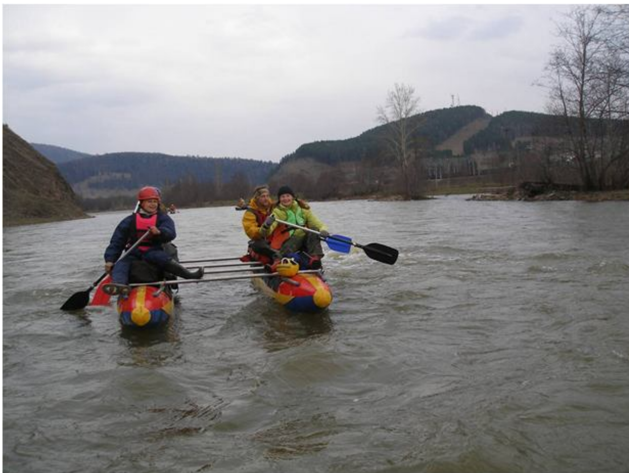
Фото №17. Проплываем посёлок Инзер.