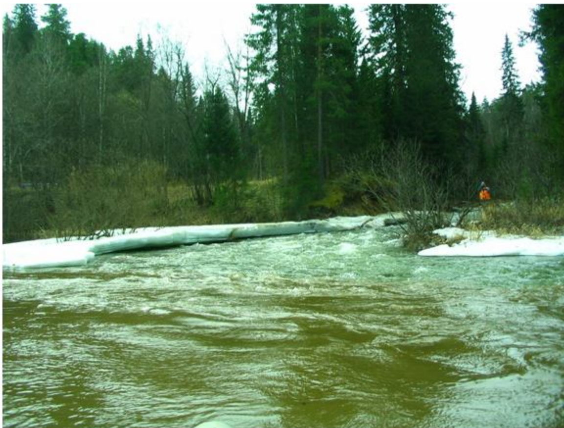
Фото №5. Устье реки Сарышта.