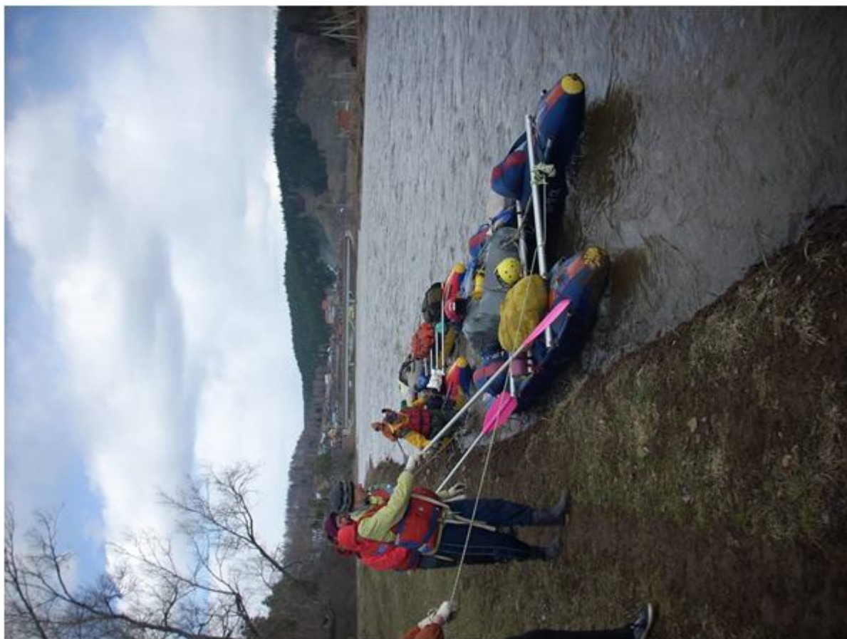
Фото №9. Обед у пос.Усмангали.