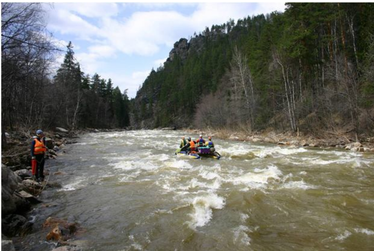
Фото №15. Точка страховки на пороге Синие скалы.