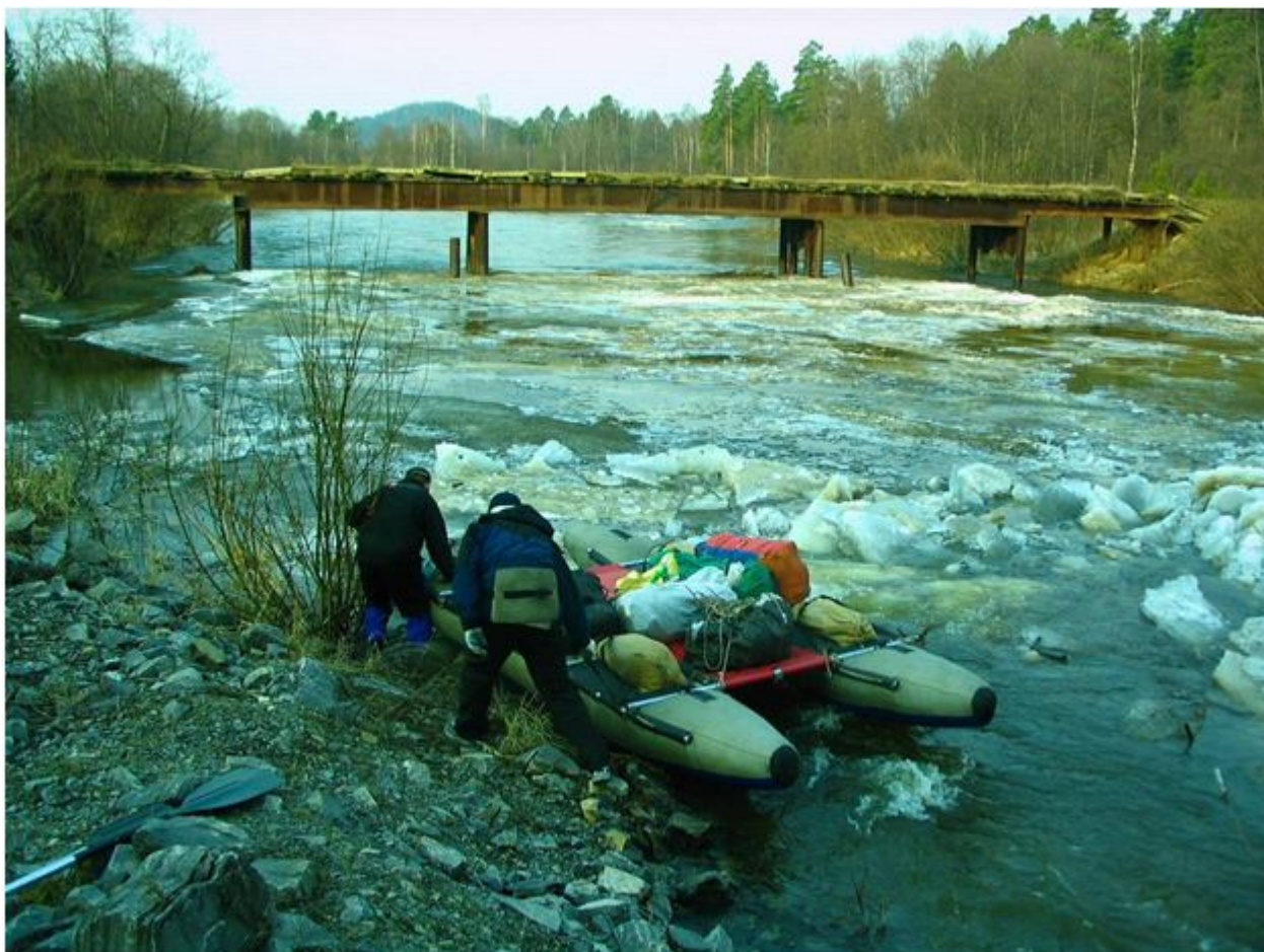
Фото №3. Обнос ледового затора.