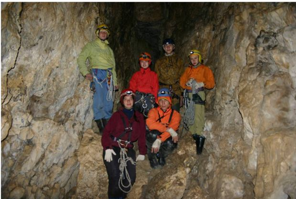
Фото №8. Пещера Кызыл-Яр, грот Гидрографов.