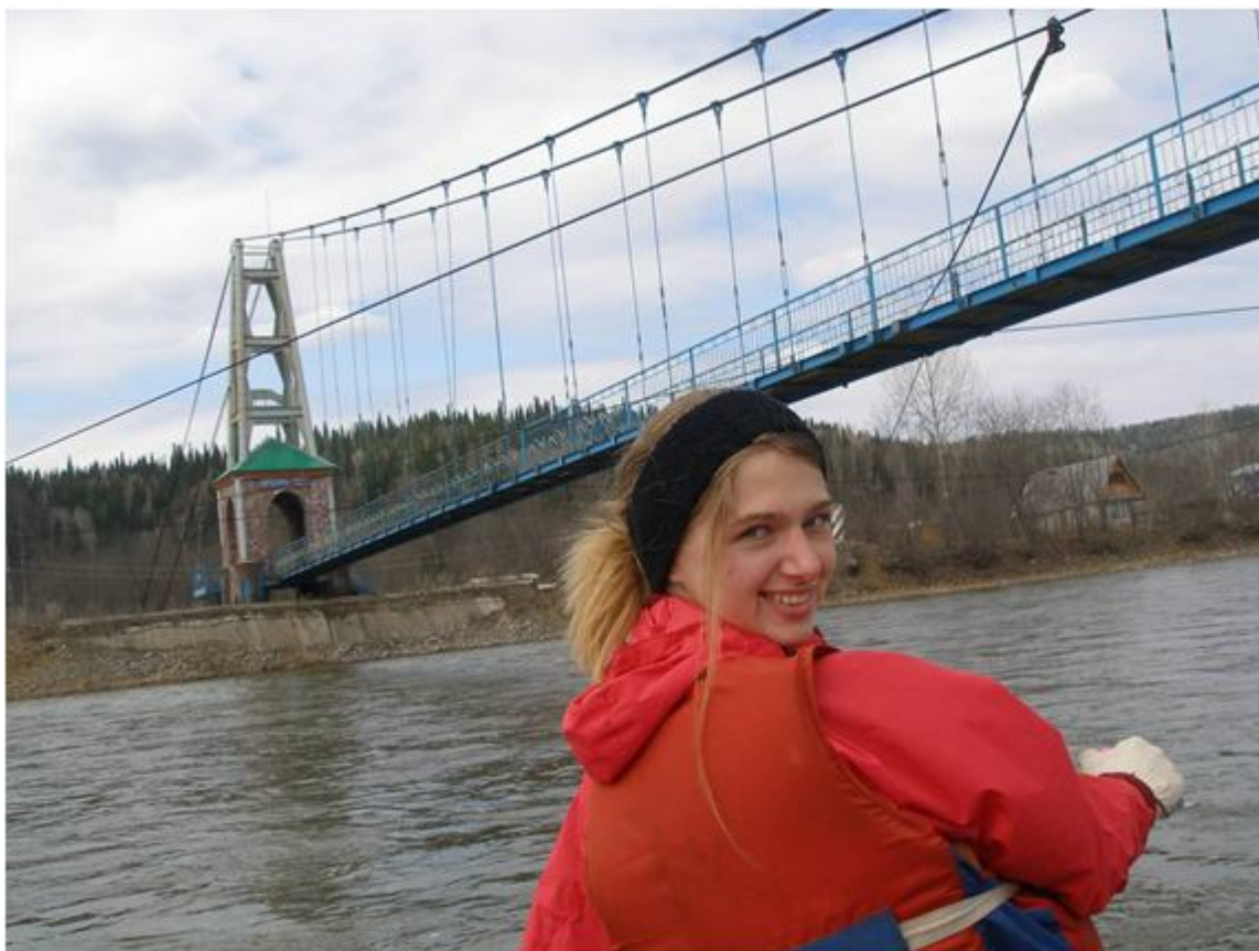
Фото №19. Юрюзань-мост. Недалеко от пос.Александровка.