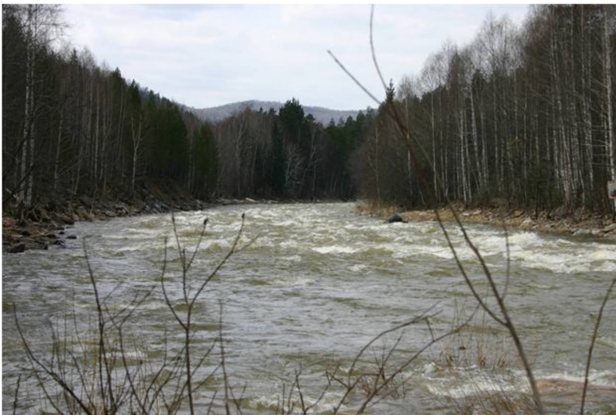
Фото №16. Айгирская шивера.