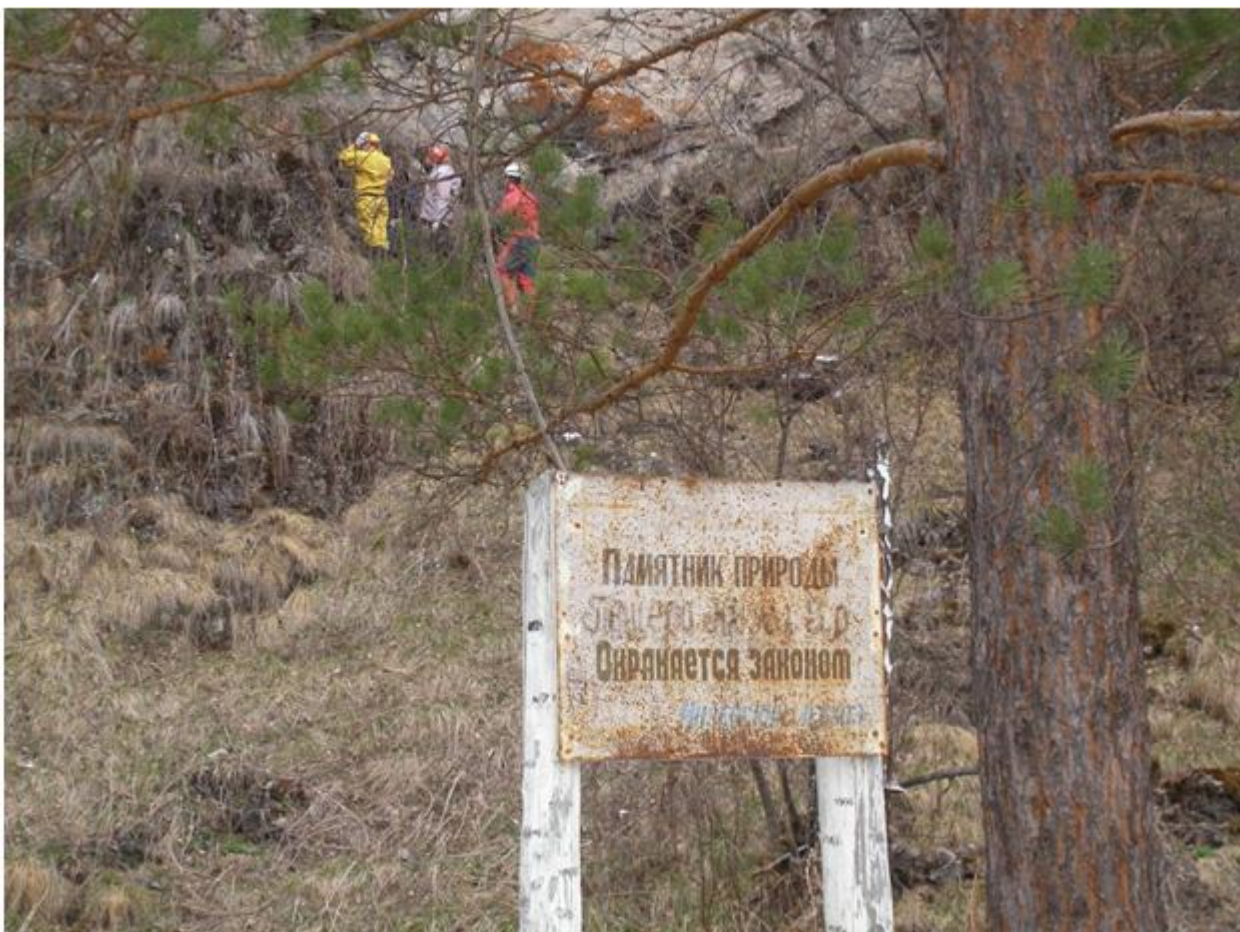
Фото №7. Табличка перед пещерой Кызыл-Яр.