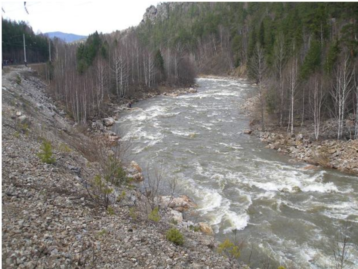
Фото №12. Порог Айгирский прорыв.