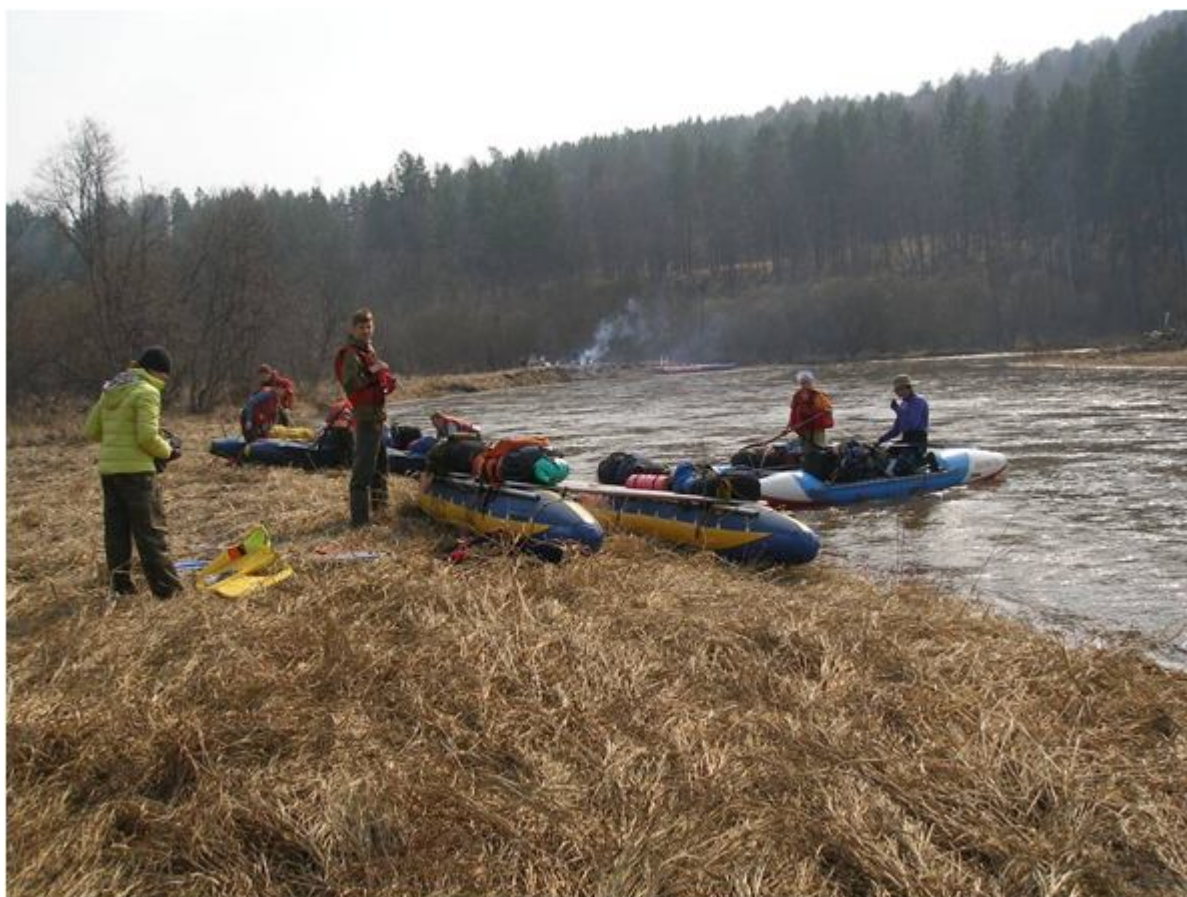
Фото №4. Устье реки Суран.