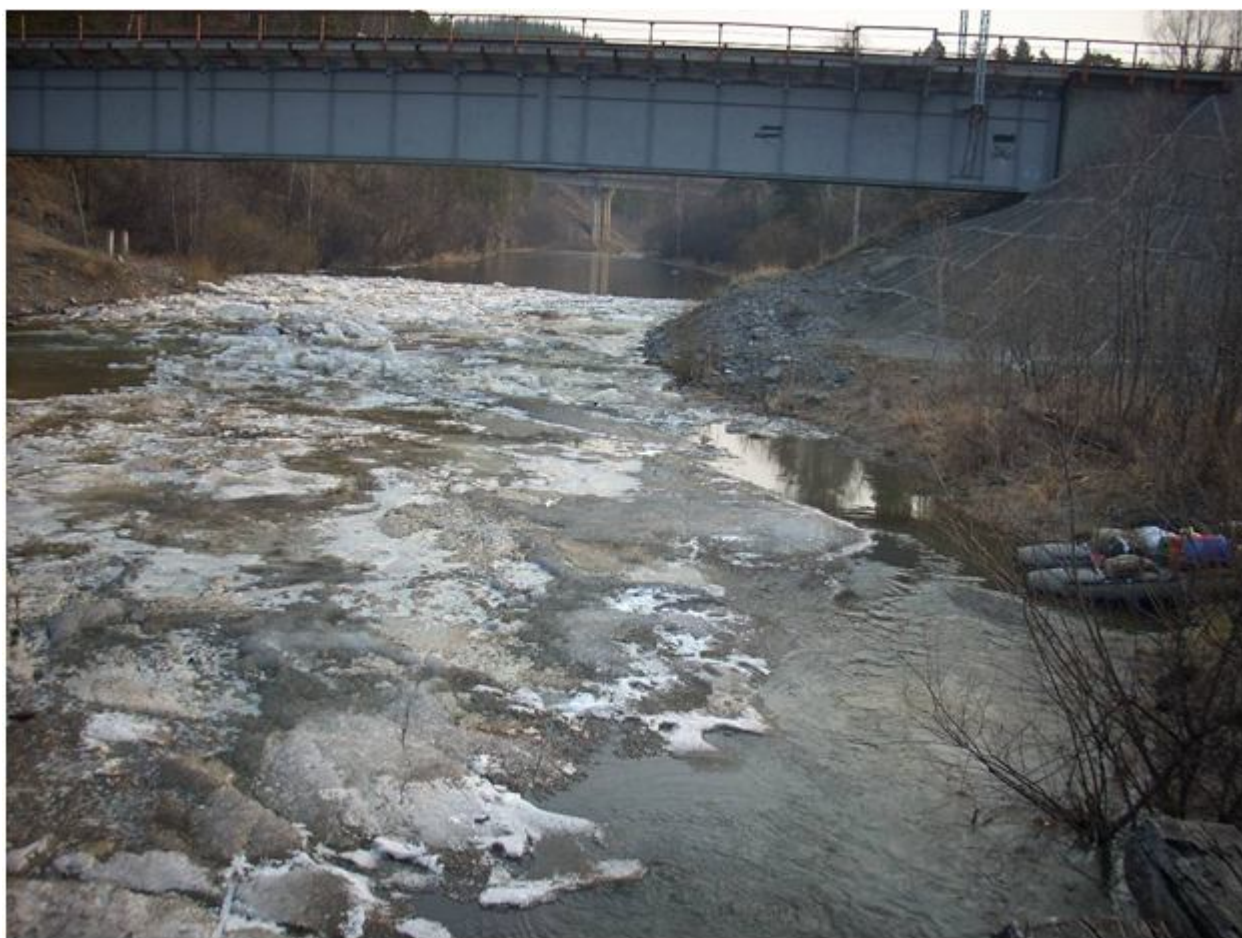
Фото №2 Ледовый затор.