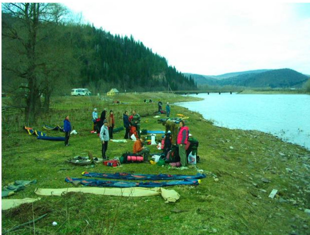
Фото №20. Посёлок Ассы. Конец маршрута.