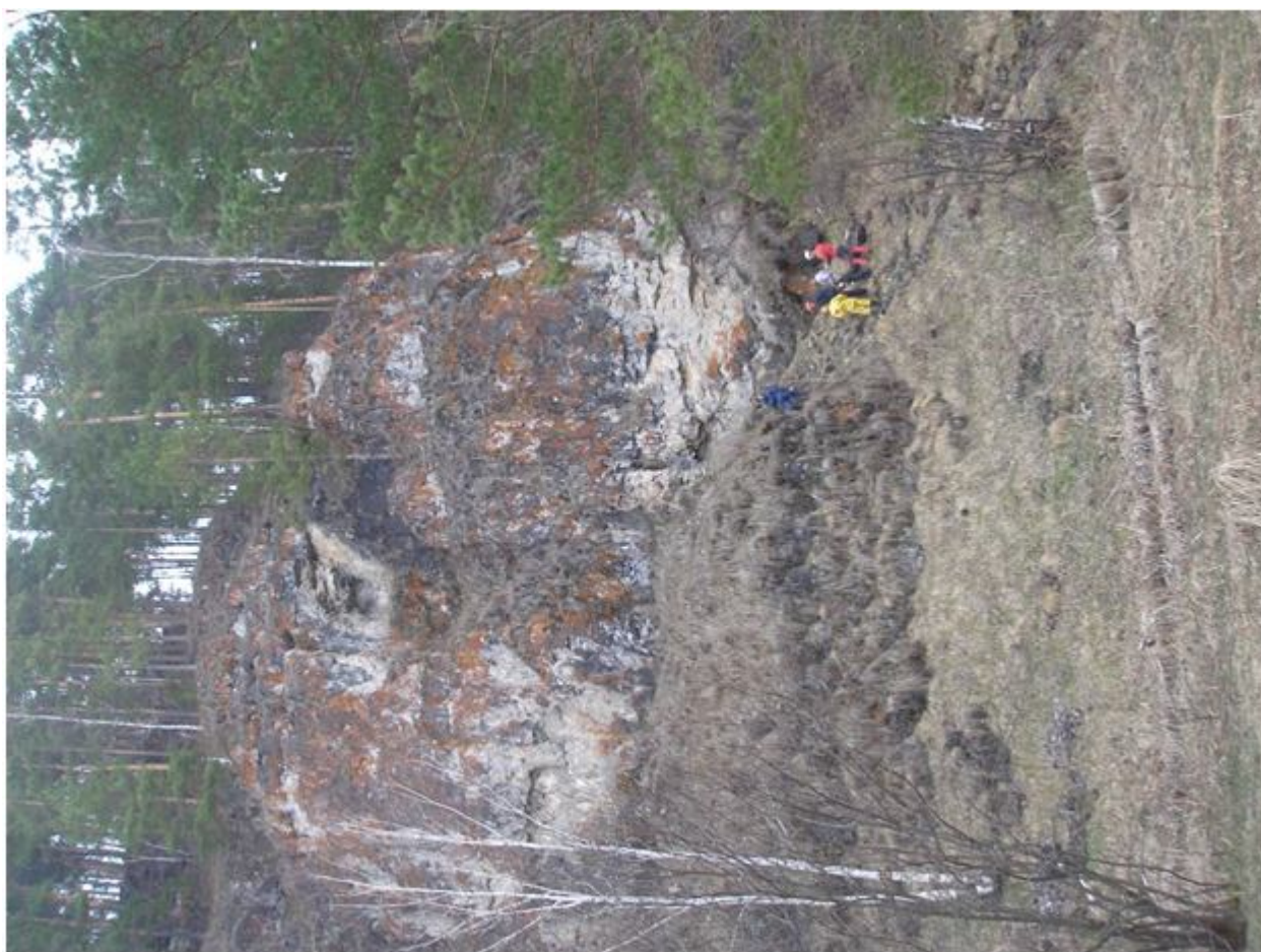
Фото №6. Вход в пещеру Кызыл-Яр.