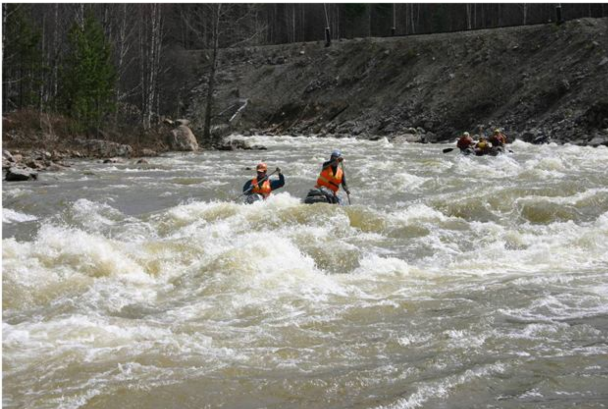
Фото №13. Прохождение порога Айгирский прорыв.